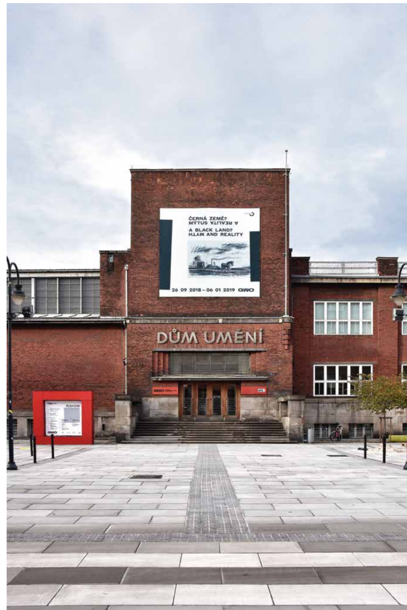
Dům umění