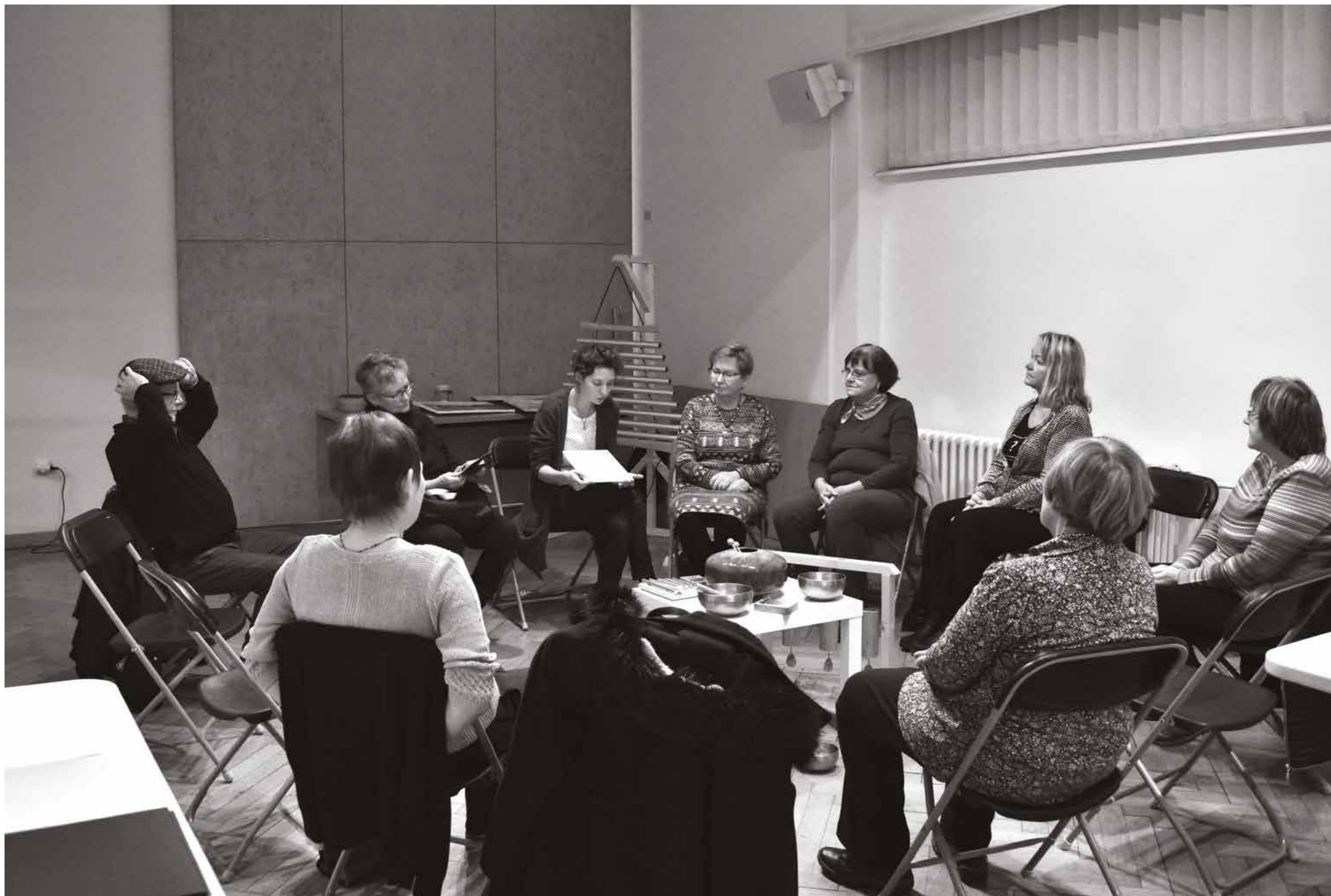
Svět za obrazy / Tvůrčí dílna pro seniory, foto: Katarína Jamříšková