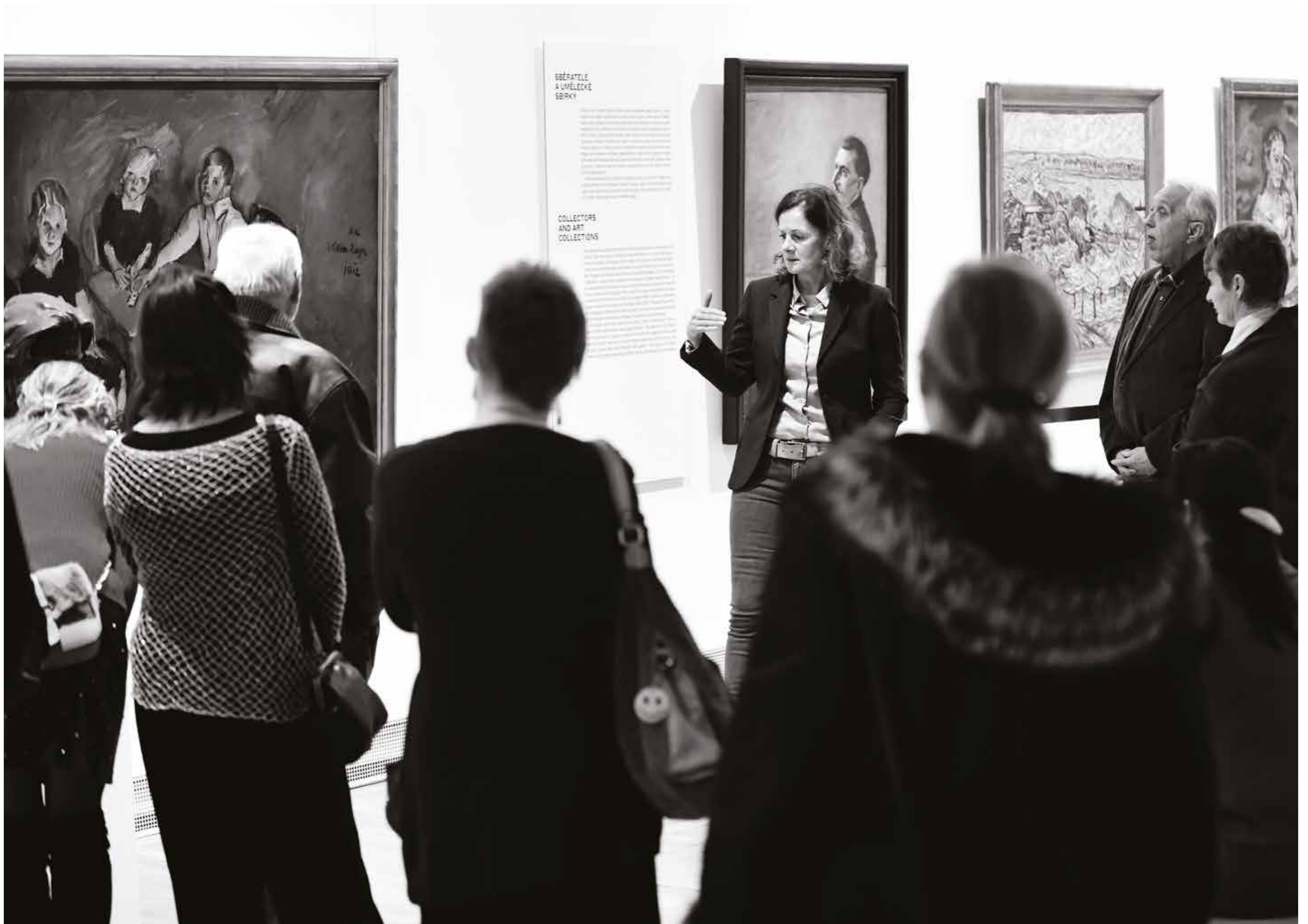
Komentovaná prohlídka výstavy Černá země? Mýtus a realita