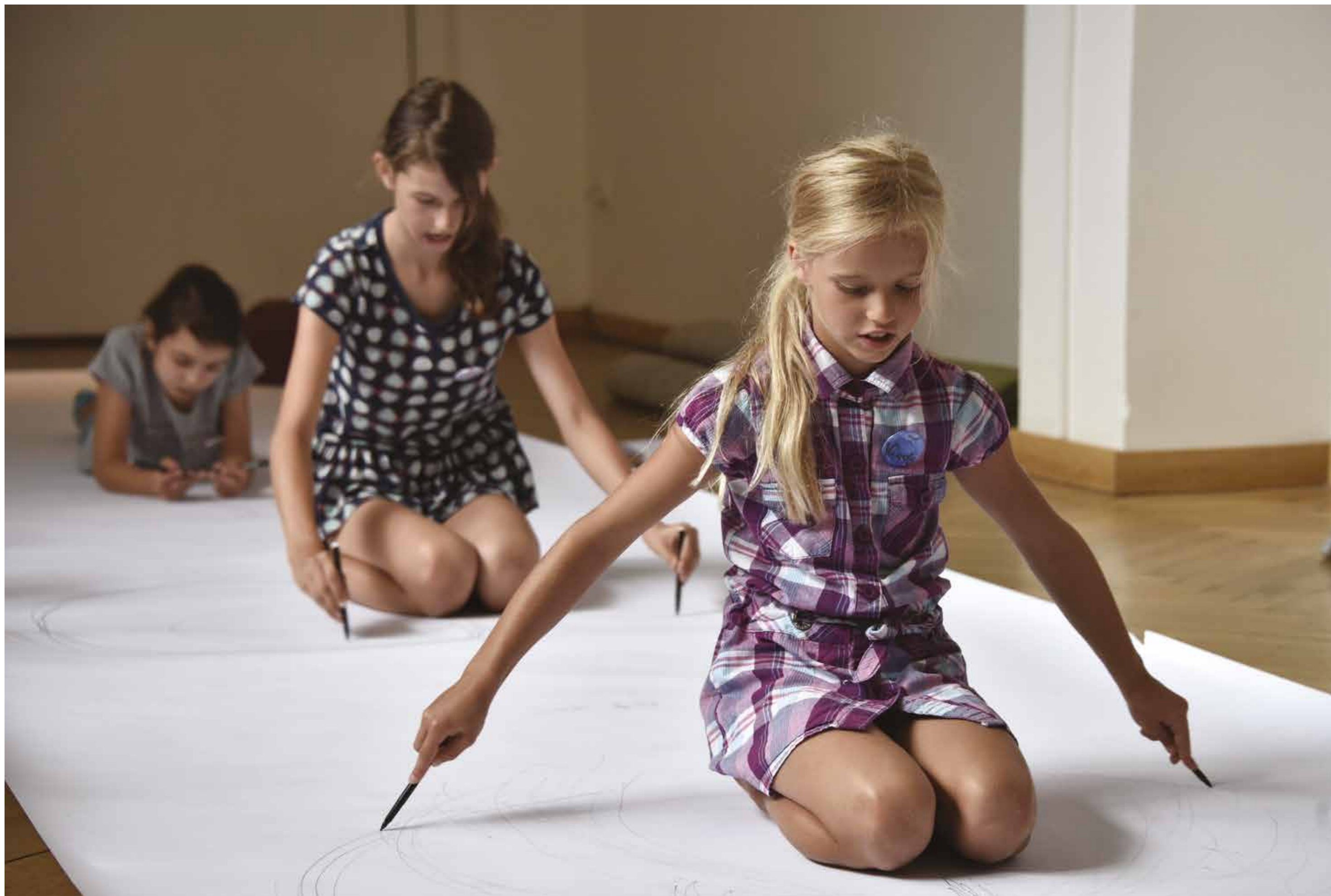
II. letní zážitková dílna „Pád na banánové slupce“, foto: Katarína Jamrišková