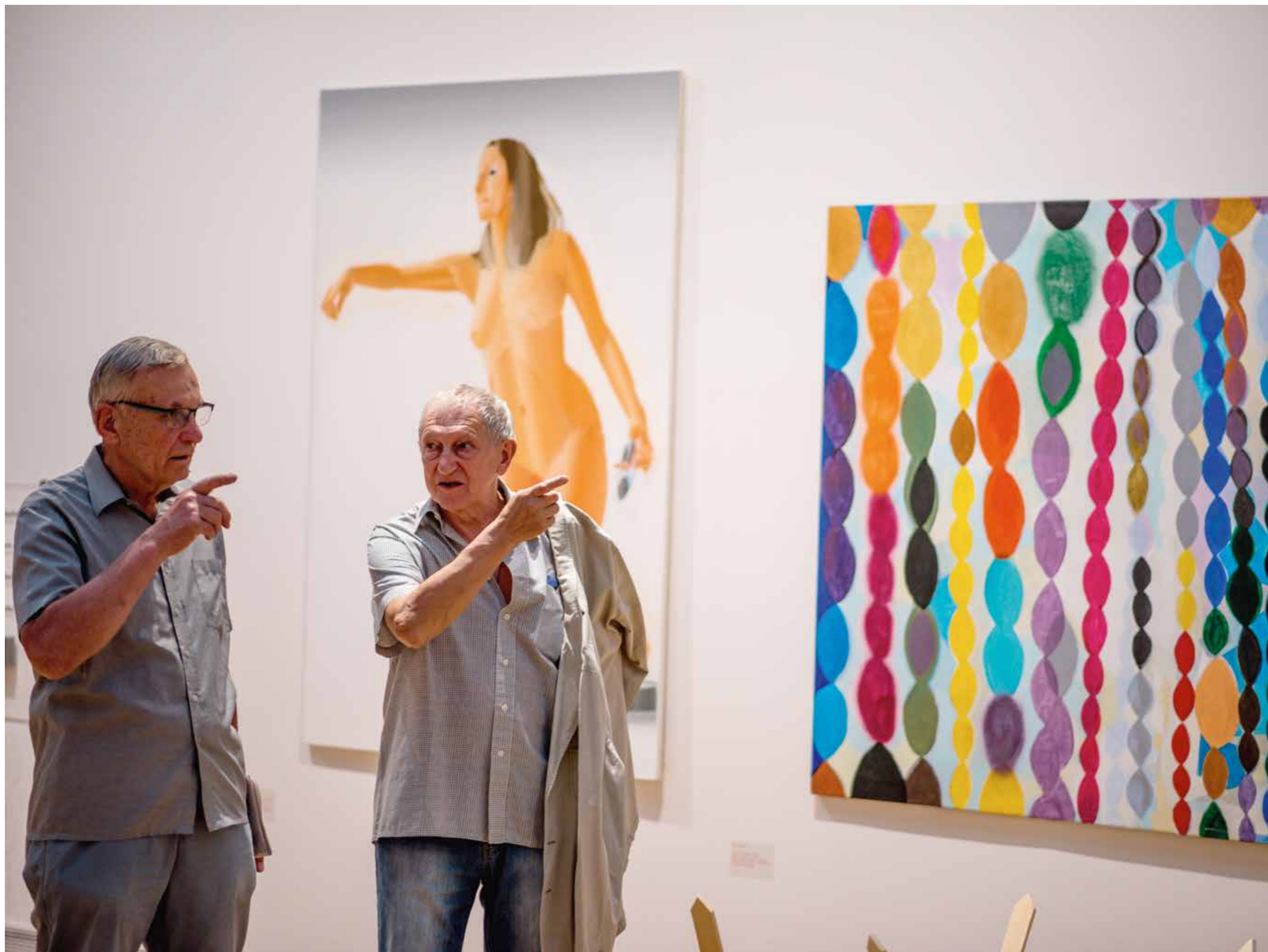
Z výstavy Kdo je vítězem?