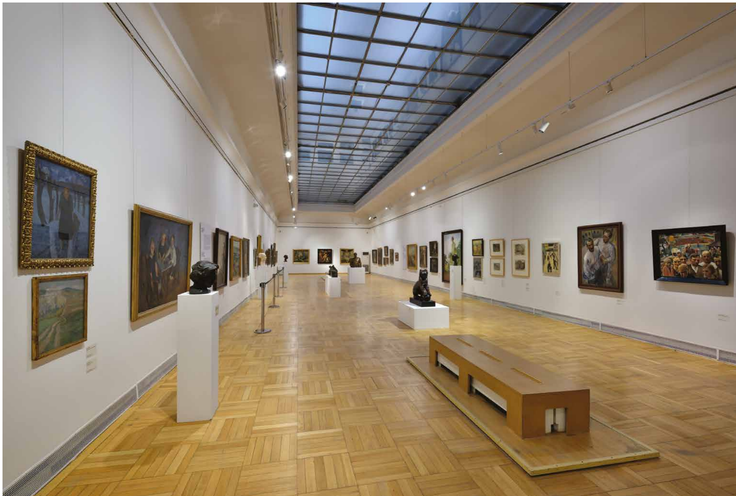
Z výstavy Černá země? Mýtus a realita