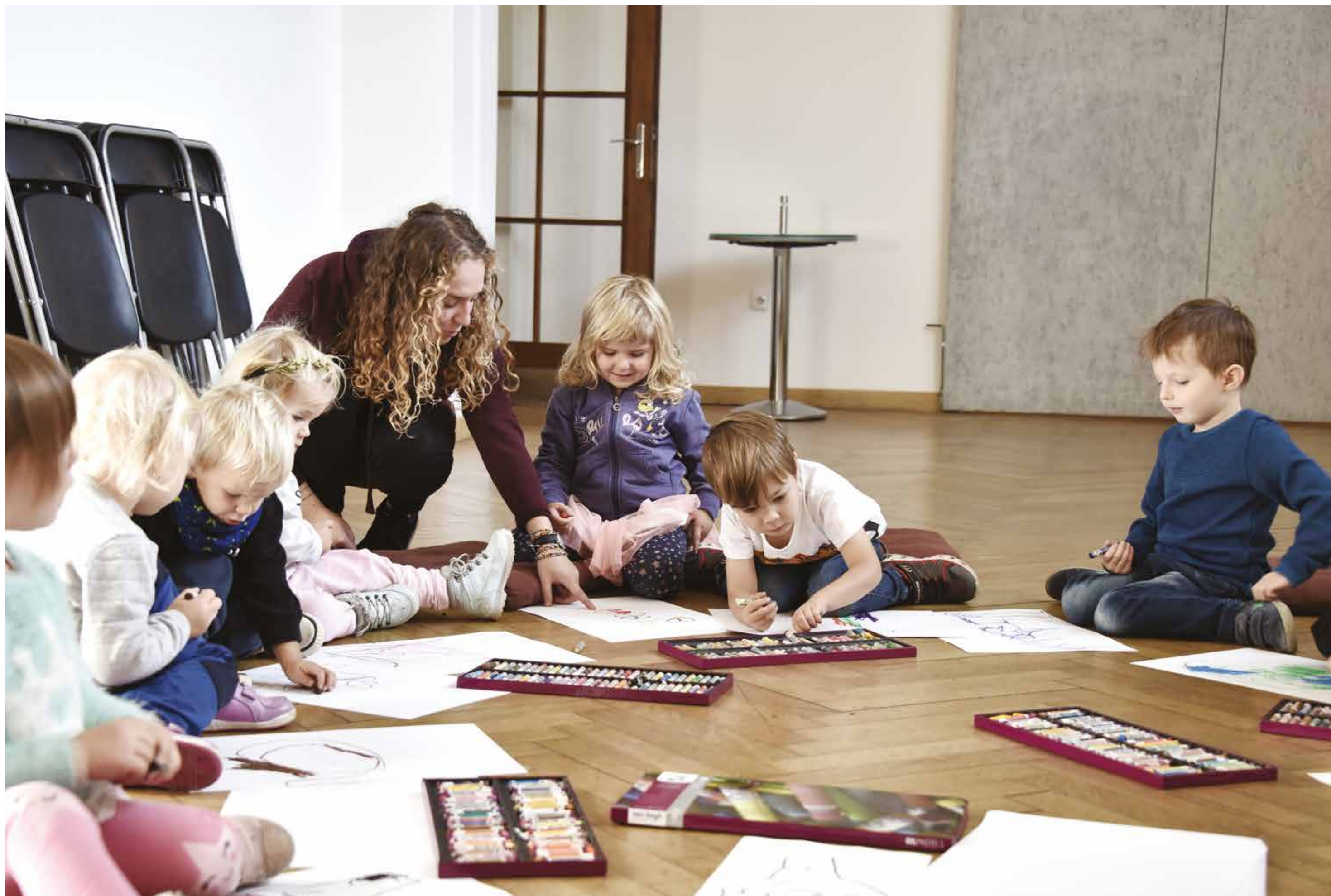
Edukační programy pro děti