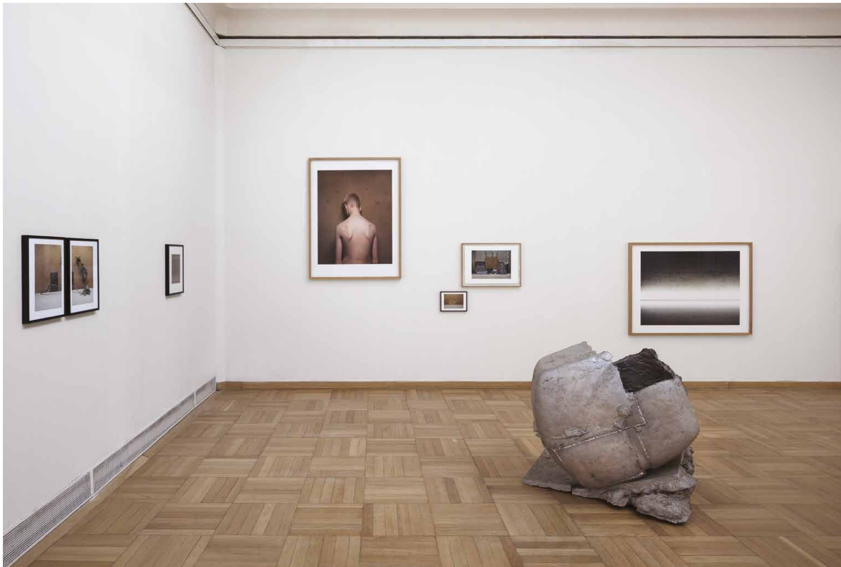
Z výstavy Ivan Pinkava / Eliáš Dolejší / Napřed uhořet / Burning Through