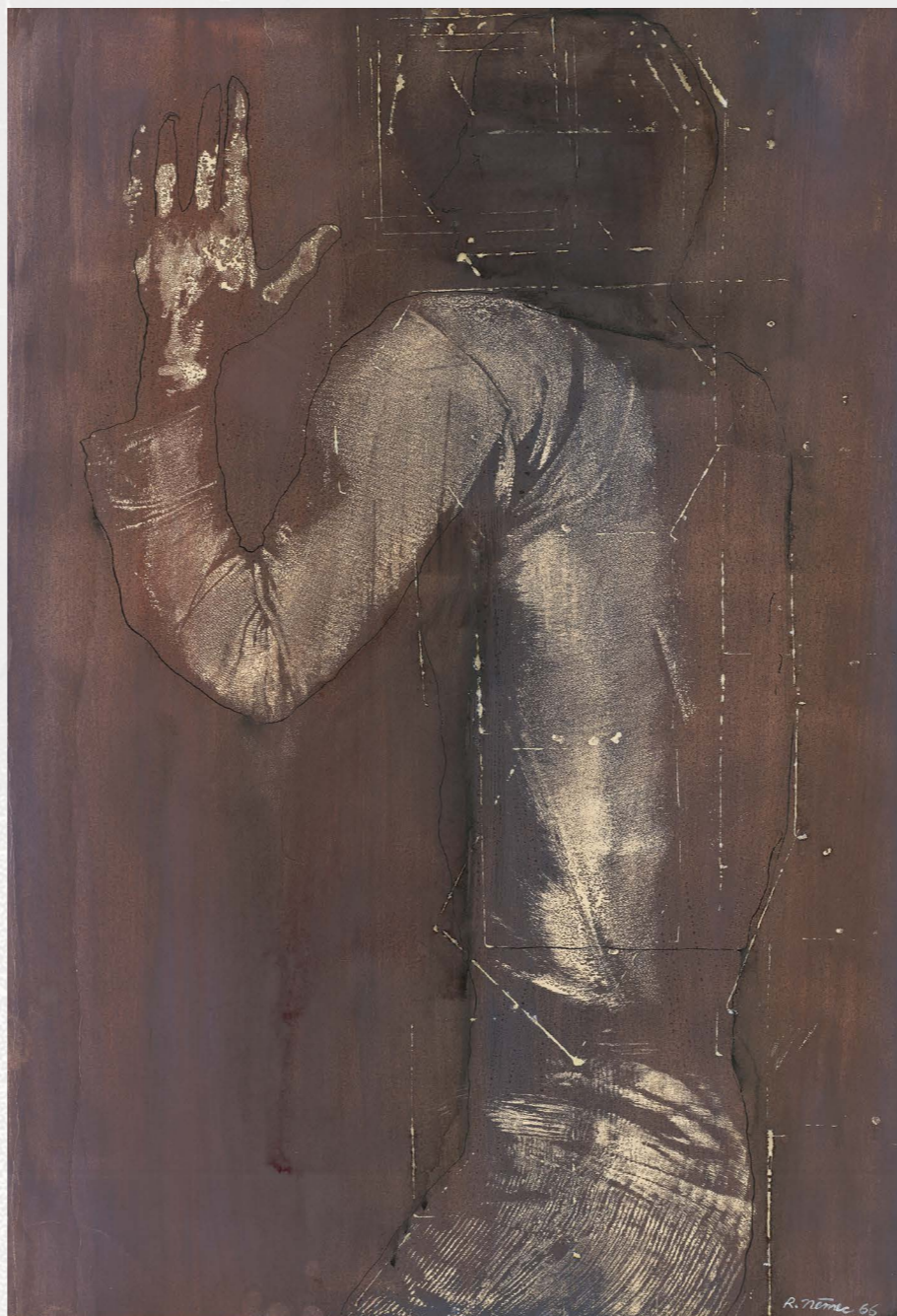
Rudolf Němec / Figura, 1966, GVUO

INSPIRUJ SE DÍLEM FIGURA A EXPERIMENTUJ S OTISKY SVÉHO TĚLA.