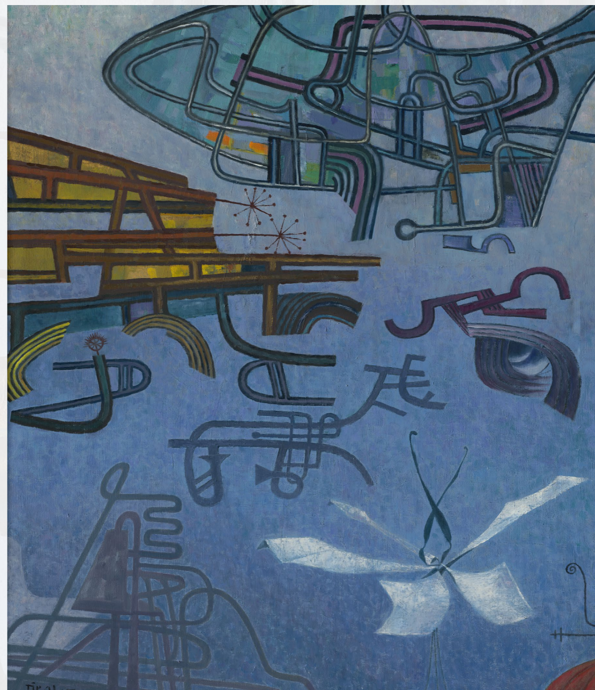
Václav Tikal / Roj satelitů, 1965

INSPIRUJ SE OBRAZEM ROJ SATELITŮ A VYTVOŘ KOMPOZICI LINIÍ A CESTIČEK Z BAREVNÝCH BAVLNEK, PROVÁZKŮ, ŠPAGET, NEBO JEN TAK ČMÁRÁNÍM PRSTEM PO ZAMLŽENÉM OKNĚ.