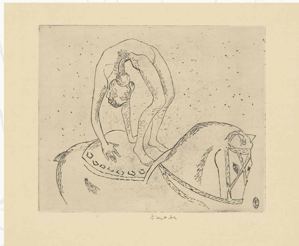
František Tichý / Akrobatka na panneau, 1940, GVUO

*pointilismus – 80. léta 19. století, výtvarná metoda, která spočívá v nanášení barevných skvrn (bodů, teček) vedle sebe na plátno, v určitém množství a vzdálenosti od obrazu skvrny vyvolávají barevnou harmonii a modelují konkrétní tvary