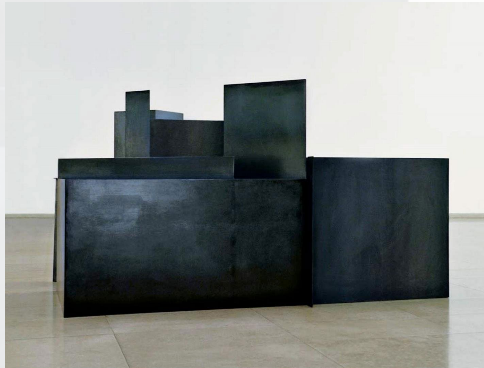
Stanislav Kolíbal / XIX, 1999

Stanislav Kolíbal patří mezi významné osobnosti české i mezinárodní výtvarné scény. Studoval grafiku na Vysoké škole uměleckoprůmyslové a scénografii na Divadelní fakultě Akademie múzických umění v Praze. Kromě soch / objektů, kterým se věnuje od 50. let, je známý také svými kresbami, grafikou, ilustrací, architektonickým řešením výstav a scénografií. V rané sochařské tvorbě mu byla častým námětem ženská figura. Zásadní zlom u něj nastal koncem 50. let, kdy se seznámil s díly Alexandera Caldera a Isamu Noguchiho. Od té doby začal více pracovat s prostorem, používat abstraktní geometrické formy, a dotýkat se tak problematiky minimalismu, instalace, konstrukce, dekonstrukce apod. Hlavním tématem se mu stala stabilita a labilita, později se začal zabývat otázkami času, trvání, rozpadu a zániku. Jako materiál volí nejčastěji sádro, dřevo, železo, sklo, provázky, nitě a další.