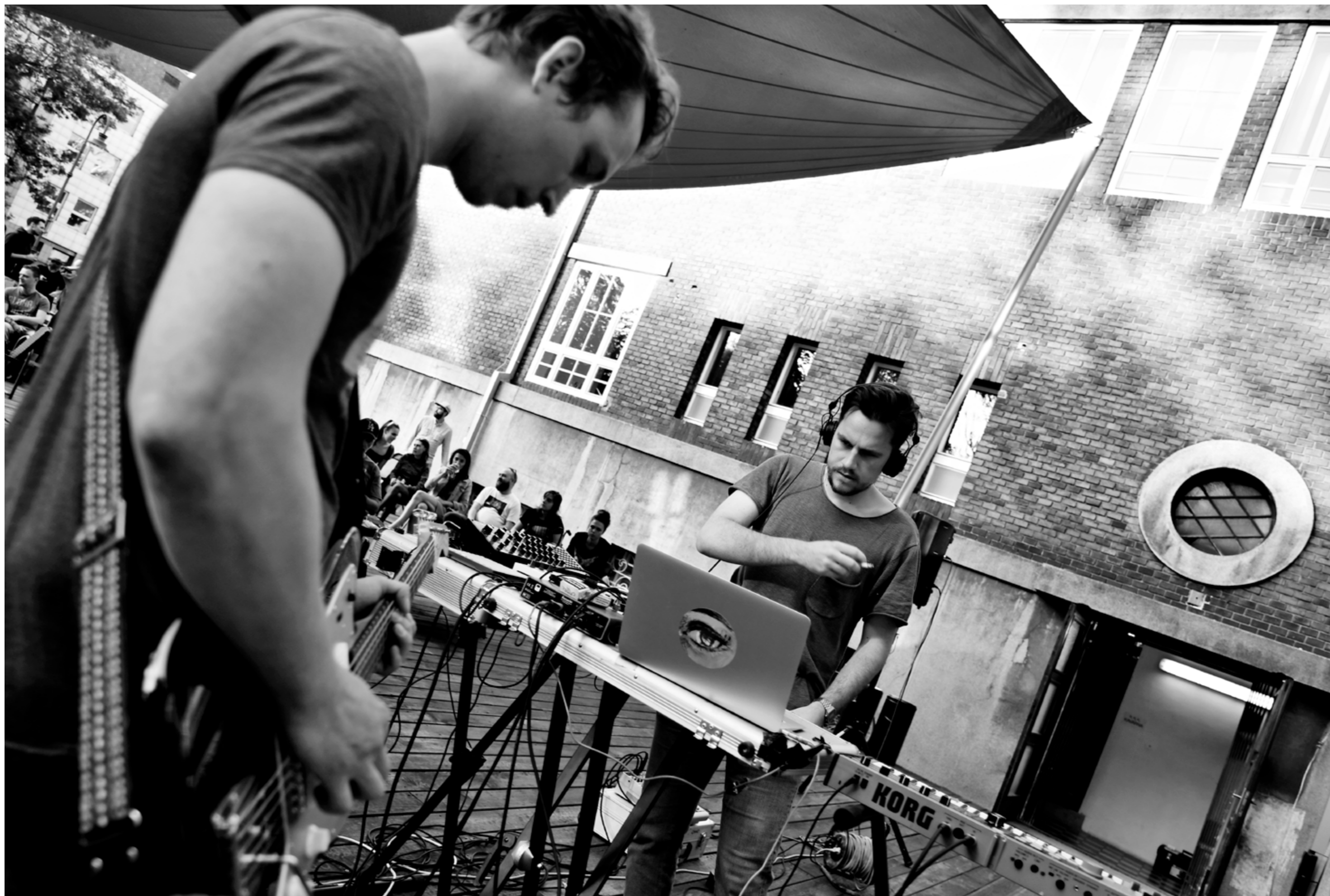
Koncert Phil Lemon