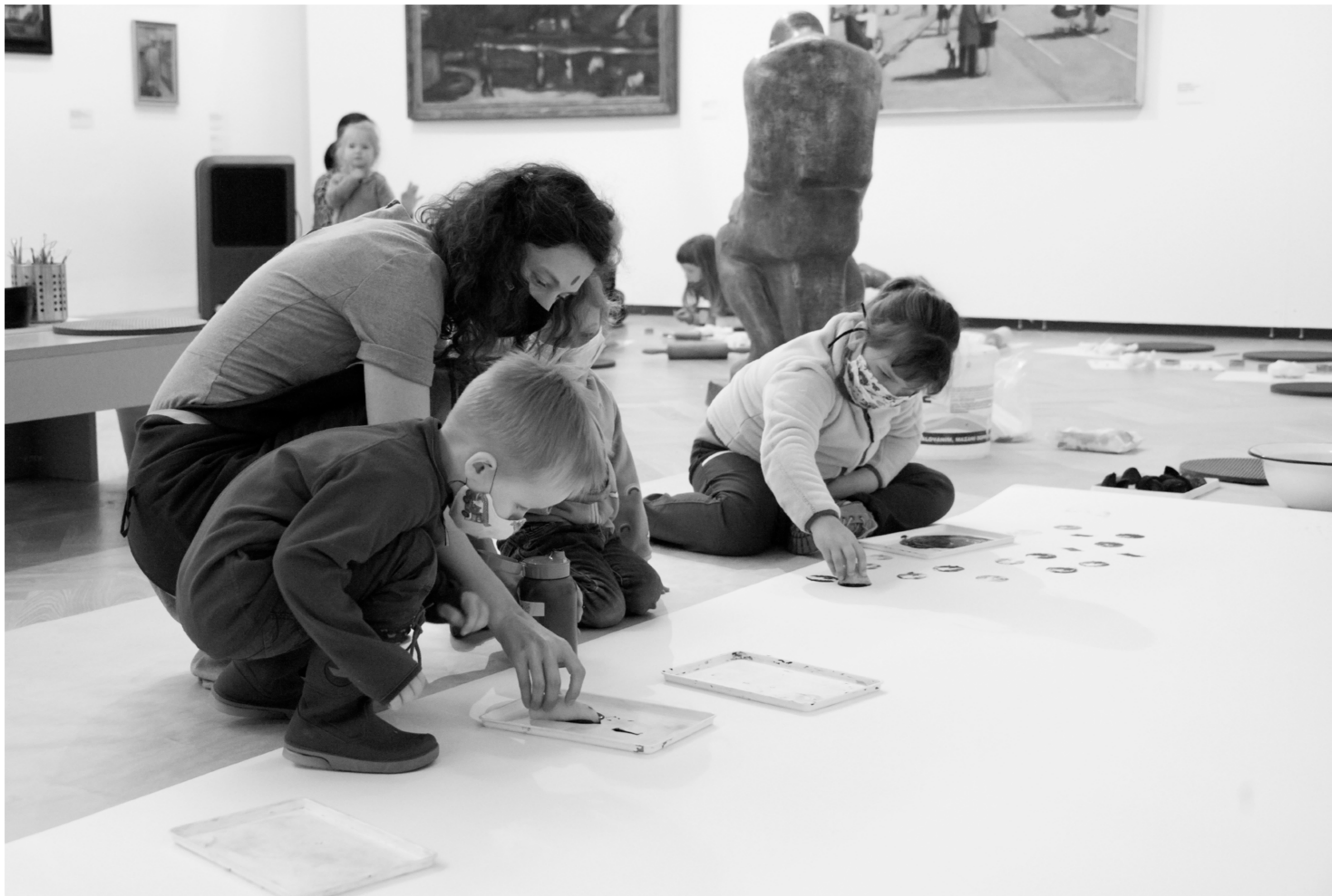
Edukační program ve výstavě