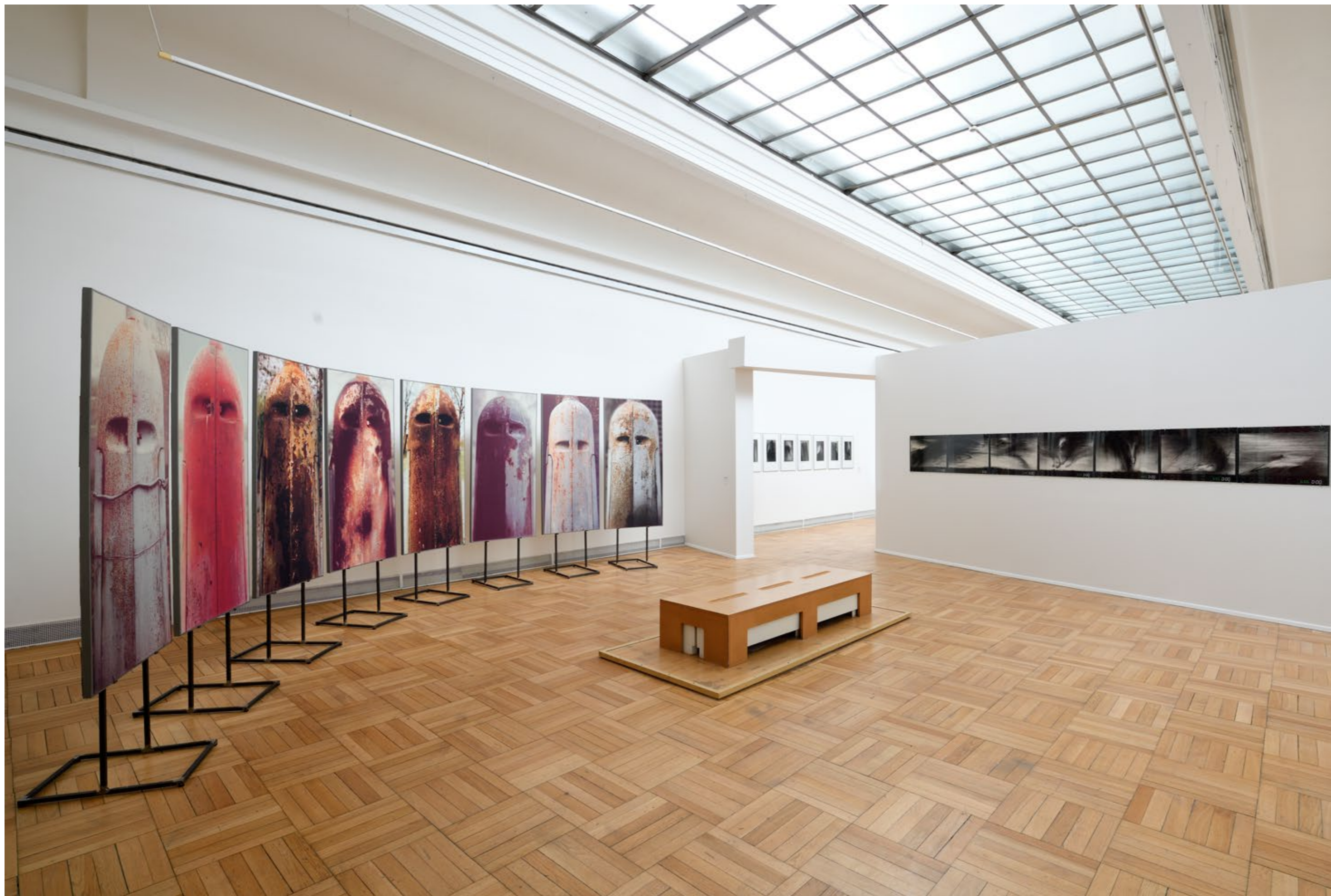
Z výstavy PAVEL NEŠLEHA / Vidět jinak