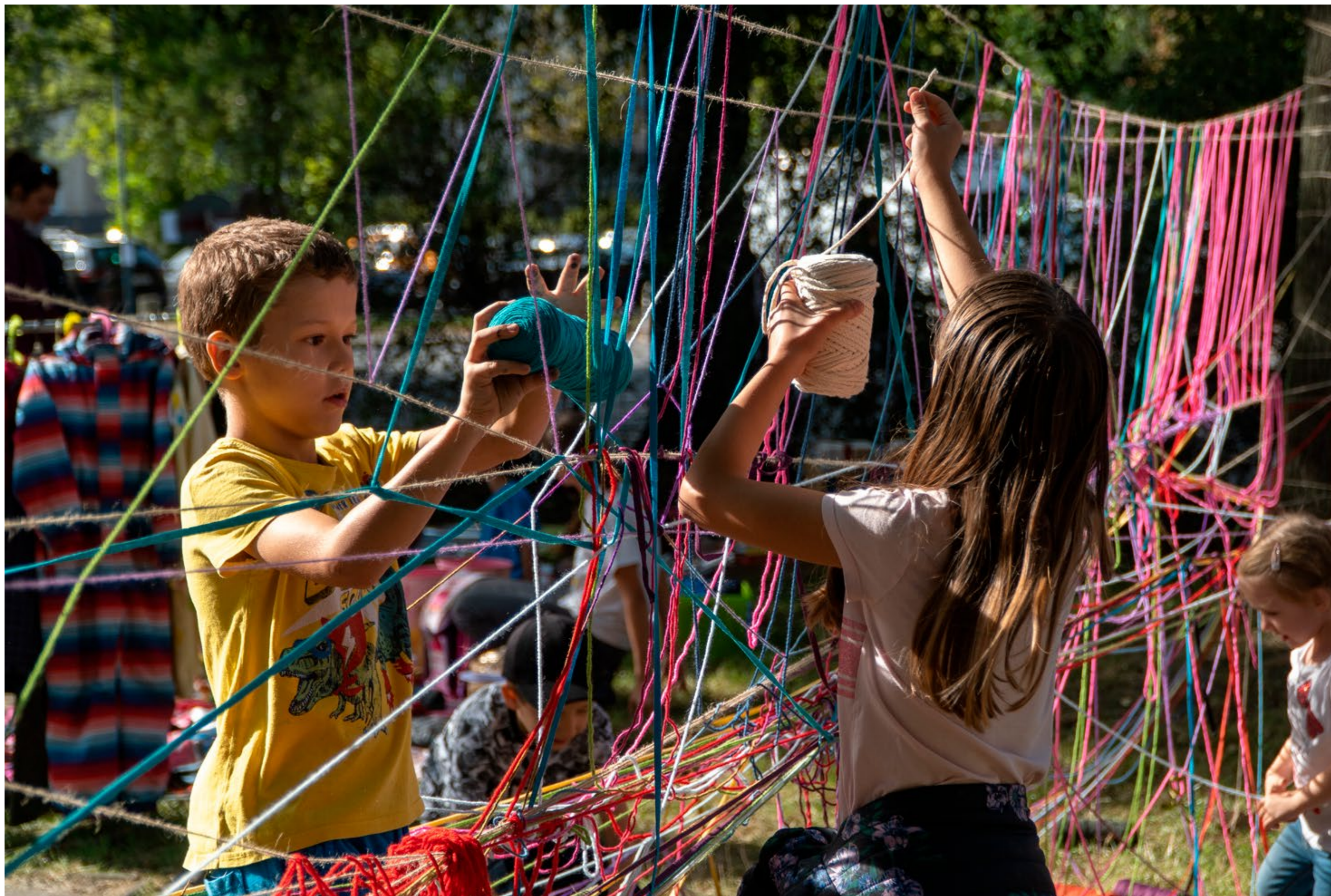
Zažit ostravu jinak, foto: Zdeněk Janošík