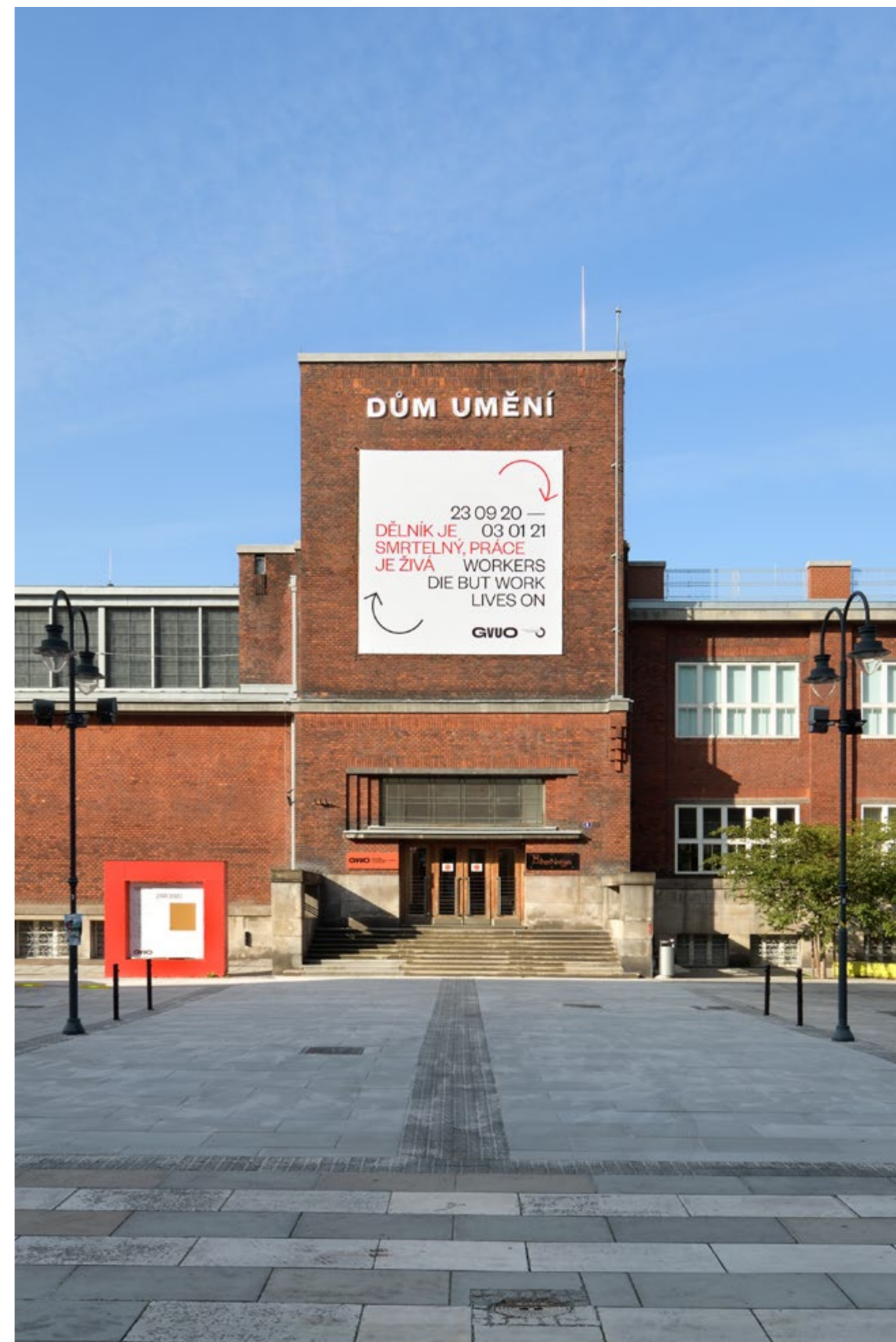
Dům umění, foto: Roman Polášek

info@gvuo.cz gvuo.cz facebook.com/gvuostrava/ instagram.com/dum_umeni_gvuo twitter.com/gvuo_dum_umeni