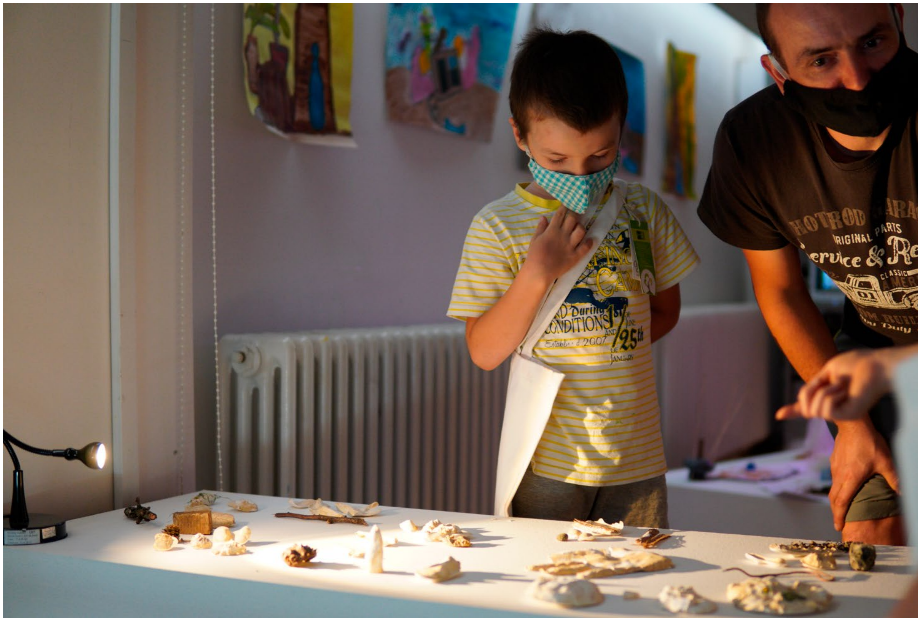
vernisaž Letní zážitkové dílny 2020, foto: Zdeněk Janošík