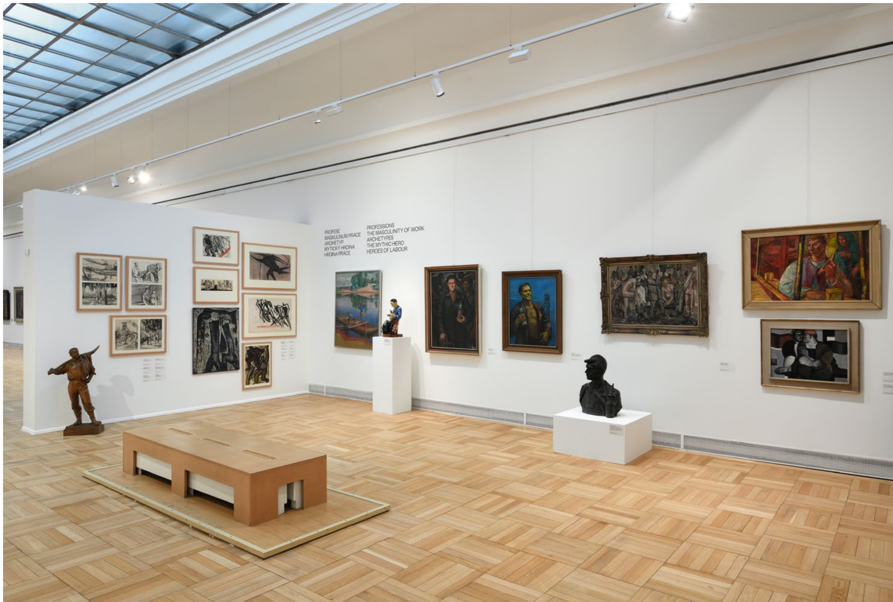
Z výstavy Dělník je smrtelný, práce je živá, foto: Roman Polášek