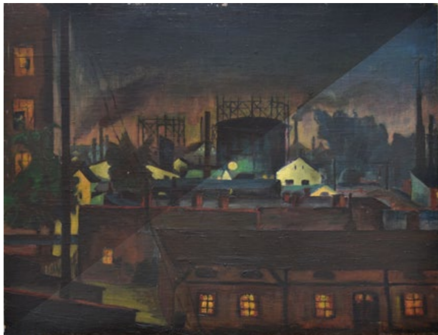
před a po O 1418 Helena Salichová, Přívoz v noci 1926, olej, plátno, 50 × 65,5 cm