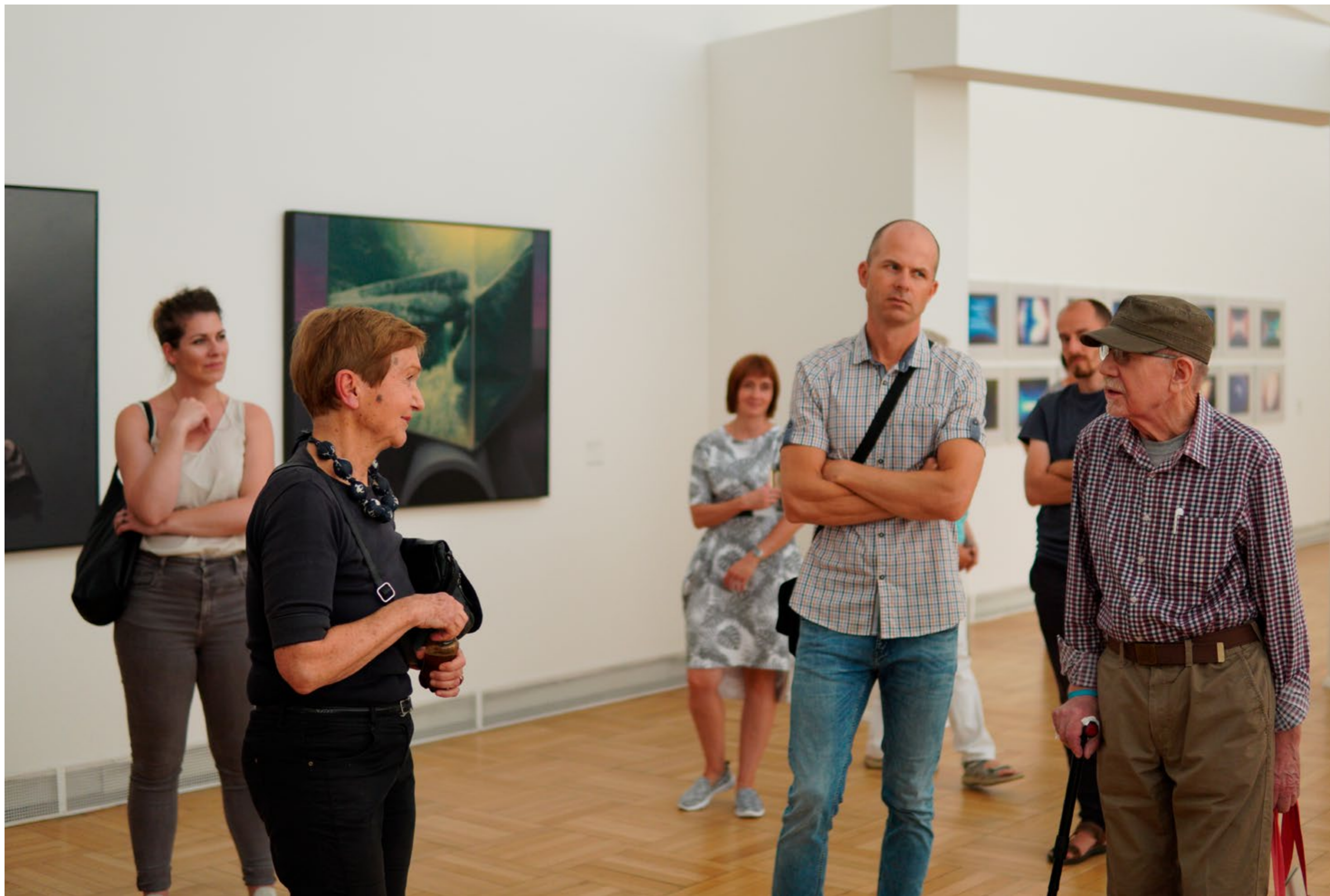
komentovaná prohlídka výstavy PAVEL NEŠLEHA / Vidět jinak