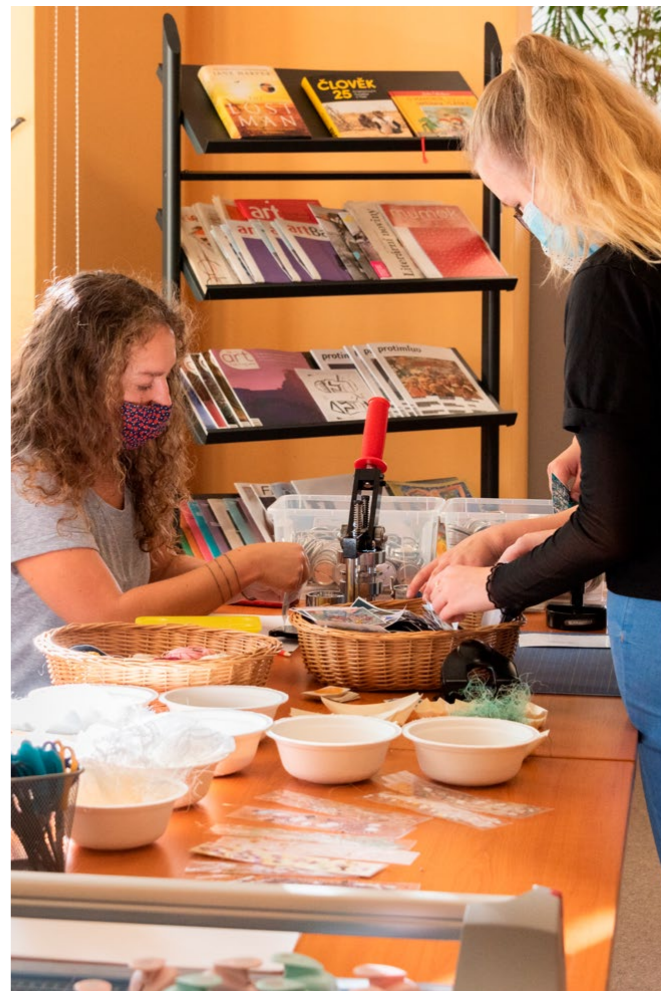
Festival ostravských knihoven

V roce 2020 jsme se zapojili do čtvrtého ročníku společné akce deseti významných ostravských knihoven (MSVK, Univerzitní knihovna OU, VŠB-TU knihovna EF, Knihovna Ostravského muzea, KMO, Knihovna NPÚ, Knihovna AMO, Knihovna GVUO, Plato, Knihovna Janáčkovy konzervatoře v Ostravě) s názvem Festival ostravských knihoven, který se uskutečnil 6. října 2020 v rámci Týdne knihoven. Knihovnu GVUO navštívilo 42 čtenářů, většina z nich poprvé.