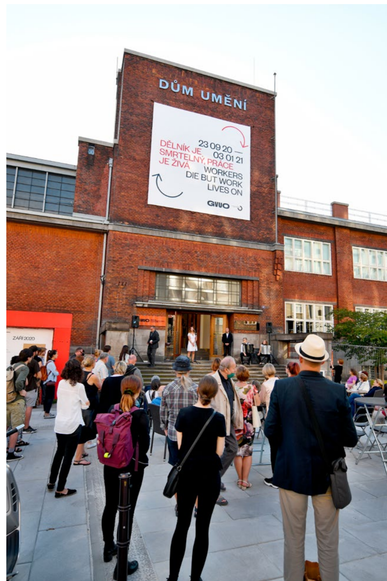
vernisáž výstavy Dělník je smrtelný, práce je živá