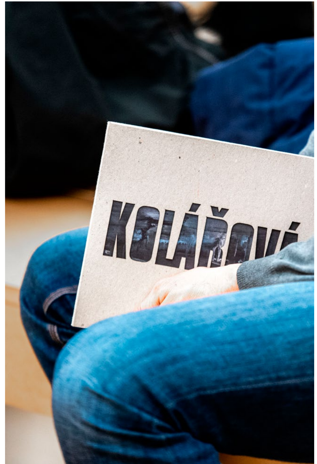
publikace Marta Kolářová