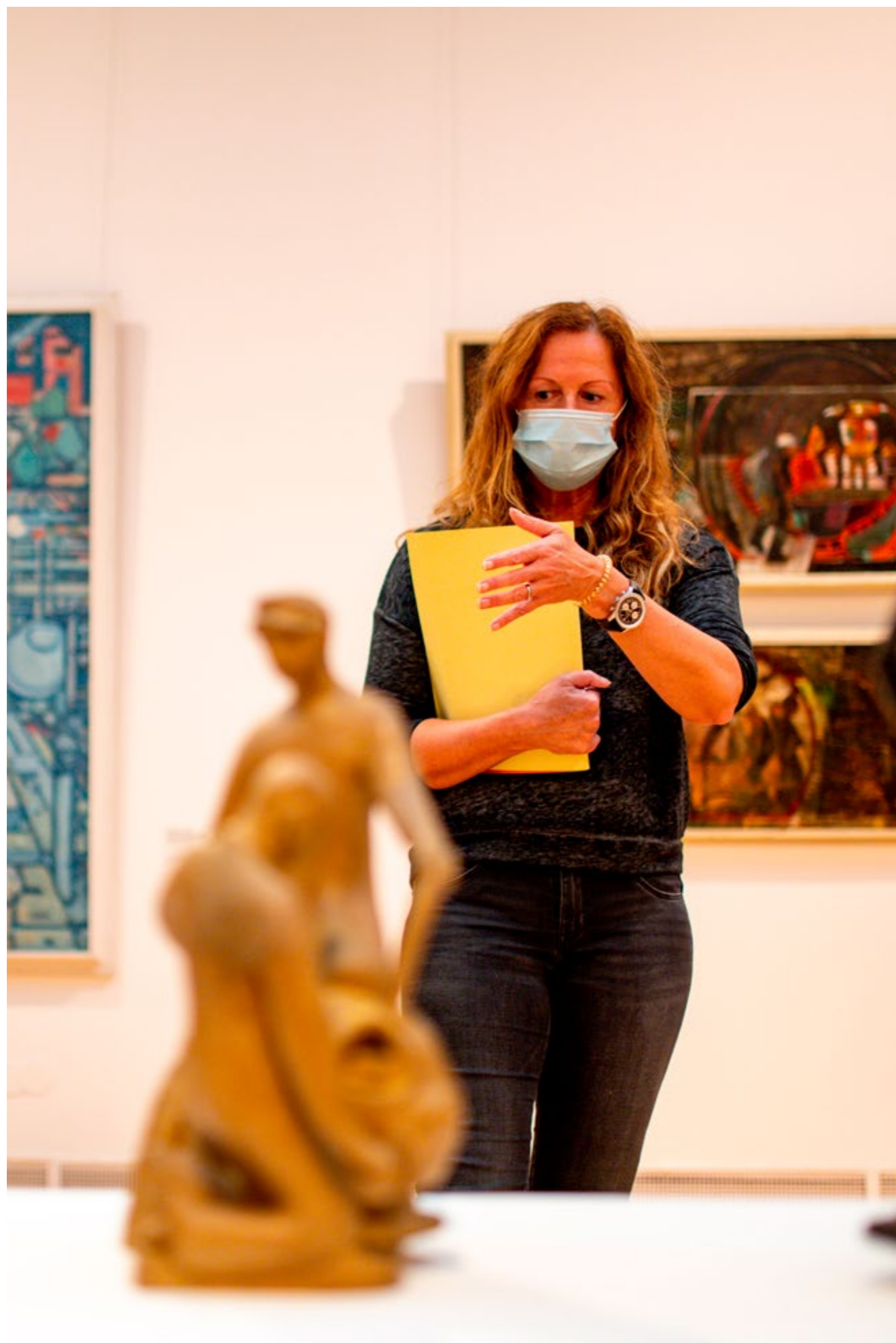
komentovaná prohlídka výstavy Dělník je smrtelný, práce je živá