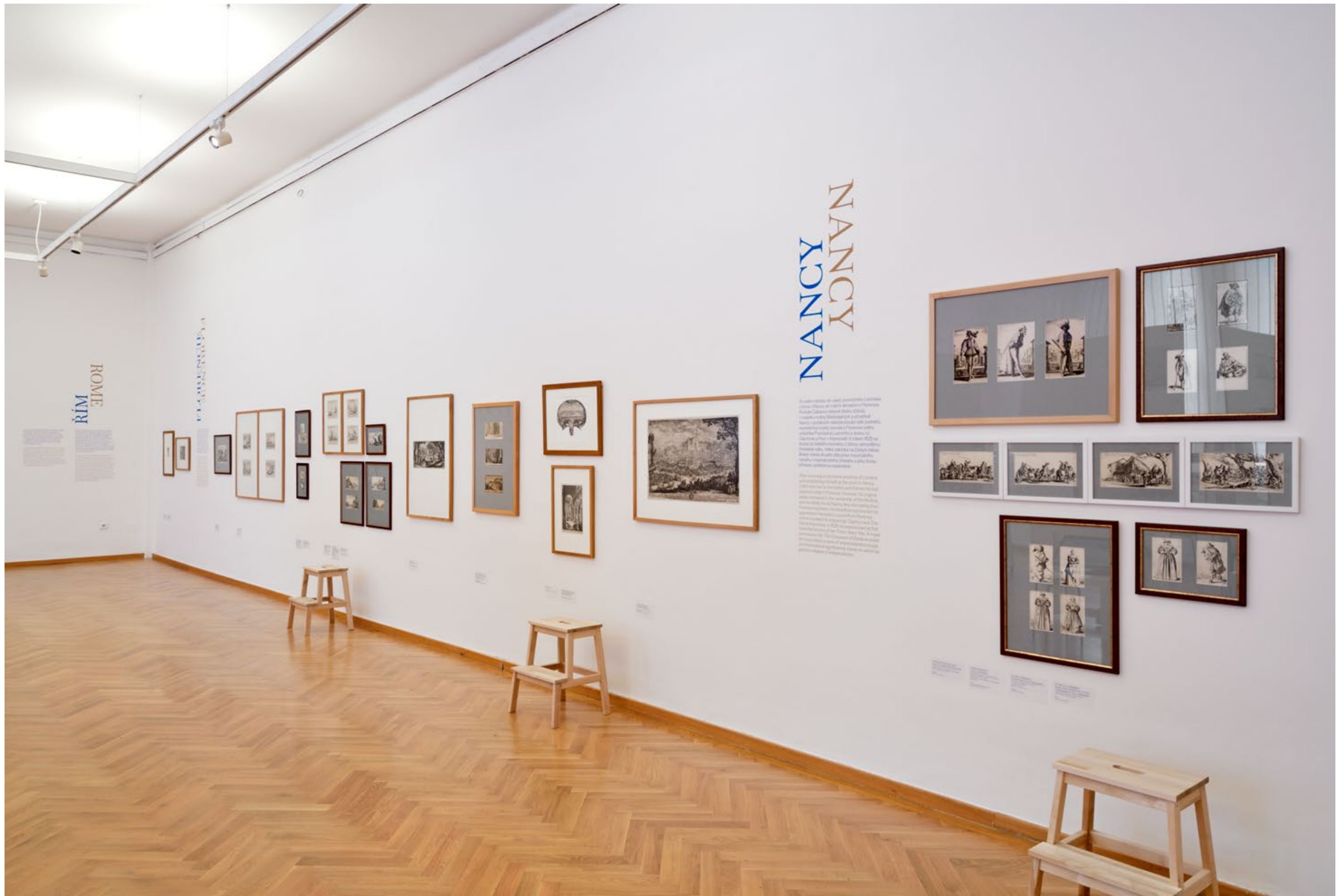
Z výstavy JACQUES CALLOT / Zrcadlo světa