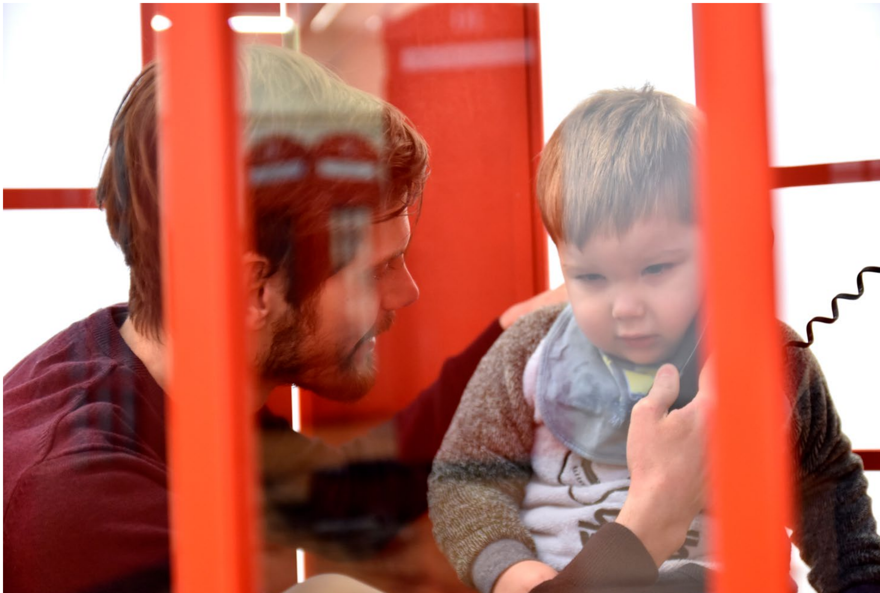
Interaktivní prohlídka a výtvarná dílna skupiny Dětský rehabilitační stacionář při MNO Poruba, p. o., Dům umění, GVUO 16. 1. 2020