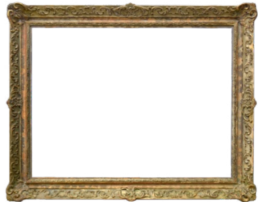
stav rámu, před a po