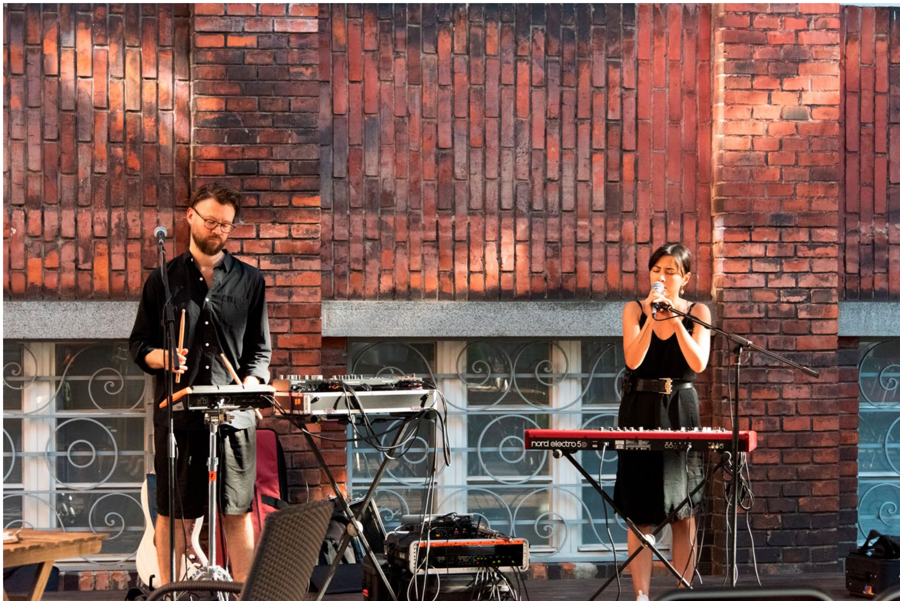
Koncert Bazel, foto: Katarína Jamrišková