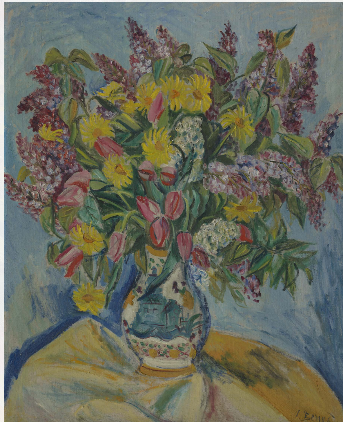
Vincenc Beneš / Kytice, 1935

Vincenc Beneš studoval na reálce v Hradci Králové, na vysoké škole Umělecko-průmyslové v Praze u Emanuela Dítěte a Emanuela Krescence Lišky a poté na Akademii výtvarných umění v Praze u Vlahy Bukovace a Rudolfa Ottenfelda. Byl členem Spolku výtvarných umělců Mánes, Skupiny výtvarných umělců, Osmy, České akademie věd a umění a dalších. Napsal několik významných teoretických studií, ve kterých se zabýval osobnostmi evropského malířství. S Otakarem Nejedlým a Pavlem Janákem založil v Praze soukromou Školu pro moderní malířství a architekturu, která však brzy zanikla. Jeho předválečná tvorba byla ovlivněna francouzským moderním malířstvím, fauvismem a kubismem, především díly Pabla Picassa, George Braqua, Bohumila Kubišty a Emila Filly. V roce 1918 se přiklonil k moderní krajinomalbě a později také k neoklasicismu. Podnikal mnoho cest do zahraničí, kde se seznamoval s díly světových umělců, jako byli Pierre Bonnard, Henri Matisse, Vincent van Gogh, Paul Cézanne a další. V cizině dosáhl uznání především v USA, Itálii, Francii, Anglii a Polsku. V roce 1933 měl soubornou výstavu v galerii Mánes. V roce 1963 byl jmenován národním umělcem. Maloval krajiny, převážně na Turnovsku, v okolí Liběchova a Písku, dále zátiší, portréty a figury. Hlavním aspektem jeho tvorby byla impresivní barevnost, světlo a uvolněnost.